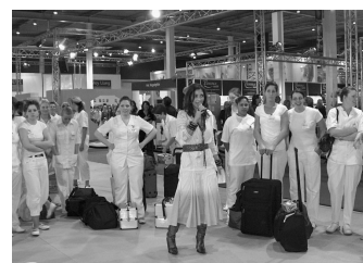
Welke twaalf kandidaten gaan naar de finale?